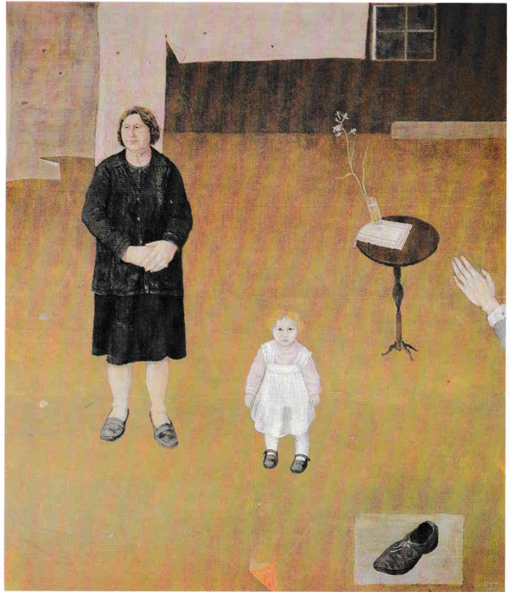
TEMPER – OIL 150 x 130 cm.